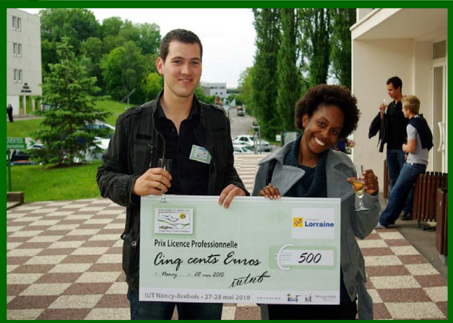
Le projet retenu & les lauréats du Challenge IUT Durable